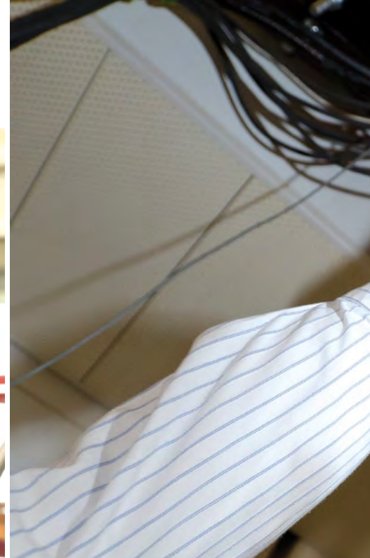
FÜR DEN KERNENTMAGNETISIERUNGS-KRYOSTAT WURDEN AN DER TU WIEN WÄNDE UND DECKEN DURCHBROCHEN. DAS GERÄT NIMMT DREI STOCKWERKE EIN.

» weit gibt es nur wenige Anlagen, die so weit runterkühlen können. Wir sind international also ganz vorne dabei“, freut sich die Professorin.